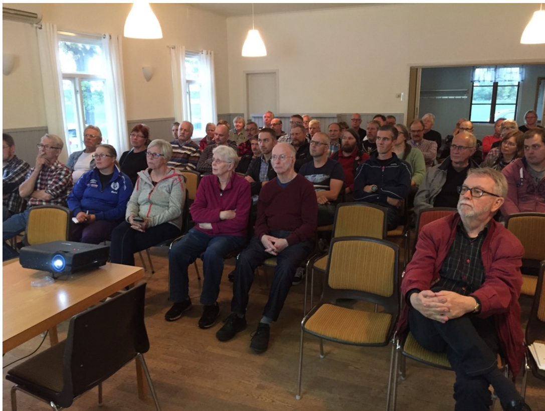
Mötesdeltagare i Näs